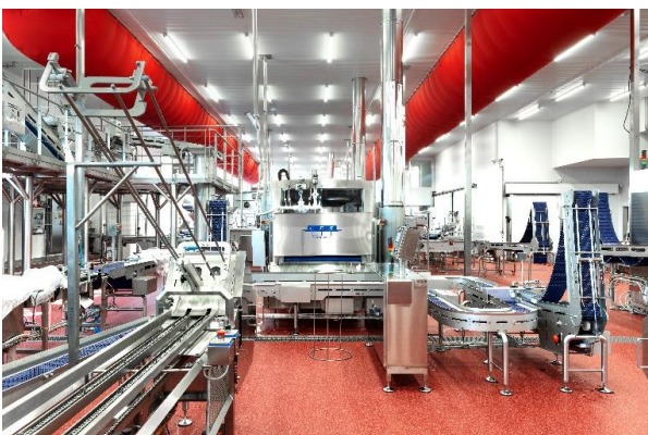
Hell und angenehm beleuchtet für maximale Mitarbeitersicherheit

in der Lebensmittelindustrie erfüllen. Gleichzeitig senken sie den Energieverbrauch und die Wartungskosten erheblich.