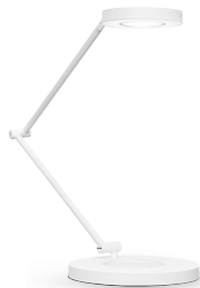
SUN@HOME Schreibtischleuchte und Stehleuchte