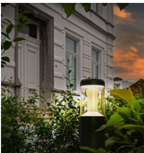
In der Außenbeleuchtung wurden vielerorts Endura Style Laternenpoller eingesetzt.

Das von LEDVANCE in Zusammenarbeit mit dem Eigentümer und dem Architekten entwickelte Beleuchtungsprojekt hat wesentlich dazu beigetragen, die architektonische Pracht des Wevers Huis hervorzuheben. Das Innere wird mit Classic B 40 DIM E14 Lampen für die schönen Kronleuchter beleuchtet, die die verschiedenen Räume schmücken. Ein besonderes Highlight findet sich in der Eingangshalle mit LEDVANCE Linear Individed Everloop, die speziell für dieses Projekt als Lichtlinie montiert wurde. Sie spendet sowohl direktes als auch indirektes warmweißes Licht, das den zentralen Korridor eindrucksvoll akzentuiert und den monumentalen Charakter des Gebäudes gleich beim Betreten unterstreicht. In den verschiedenen Räumen wurden auch Wohnraumleuchten wie Decor Tokyo Table, Planon Frameless für die Decken, Panan Alu als Schreibtisch-beleuchtung und Einbaustrahler Darklight Fix eingesetzt. Bei der Außenbeleuchtung wurden an vielen Stellen Endura Style Laternenpoller verwendet.