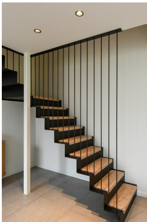
Die Einbaustrahler Darklight Fix wurden in mehreren Räumen eingesetzt

Durch die Kombination von Lösungen aus dem LEDVANCE-Sortiment für den professionellen und privaten Bereich und in enger Zusammenarbeit mit einem renommierten Innenarchitekten wurden verschiedene Beleuchtungslösungen realisiert, die perfekt zum gewählten Stil passen und das Design dieses historischen Gebäudes von 1880 als das Beste aus beiden Welten respektieren.