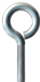
Ucho do rusztowań M8 x 40mm