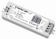
Sterownik do taśm jednokolorowych SC LED strips controller