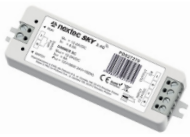
Sterownik do taśm jednokolorowych SC LED strips controller