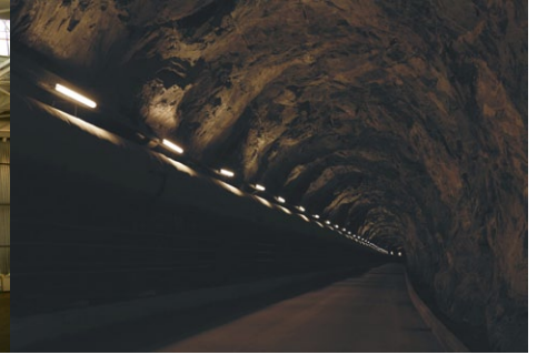
Sieć elektrowni wodnych Statkraft Energi AS, Norwegia