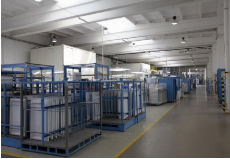
Hala magazynowa i produkcyjna firmy Merloni Indesit Polska Sp. z o.o. Łódź