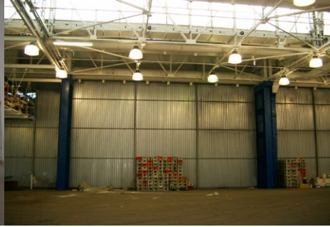
Hala produkcyjna firmy FIAT, Bielsko Biala